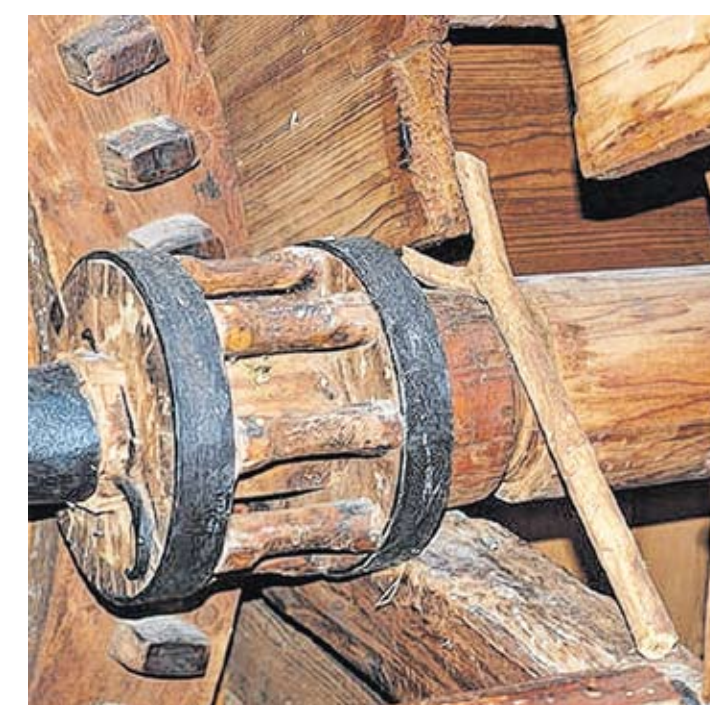
Kleinhölzer wurden z. B. bei Zahnrädern und Werkzeuggriffen und -stielen eingesetzt. Rechts: Ein Schüler prüft den Brennwert eines Strauchholzes.

Für die Zähne eines Heurhebers nahm man die zähe Berberitze. Leitersprossen wiederum fertigte man aus den stabilen Ästen der Kornelkirsche. Auch für Zahnräder und Werkzeuggriffe gab es bevorzugte Sorten von Strauchholz und kleinen Bäumen.