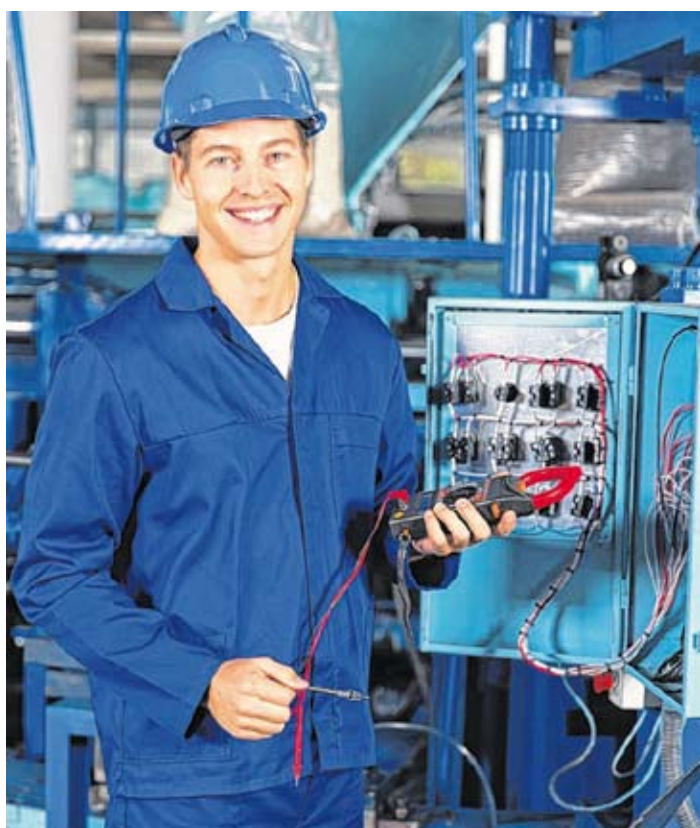
Ein Abschluss an einer berufsbildenden höheren Schule macht sich auf dem Arbeitsmarkt bezahlt, nur Akademiker verdienen mehr.