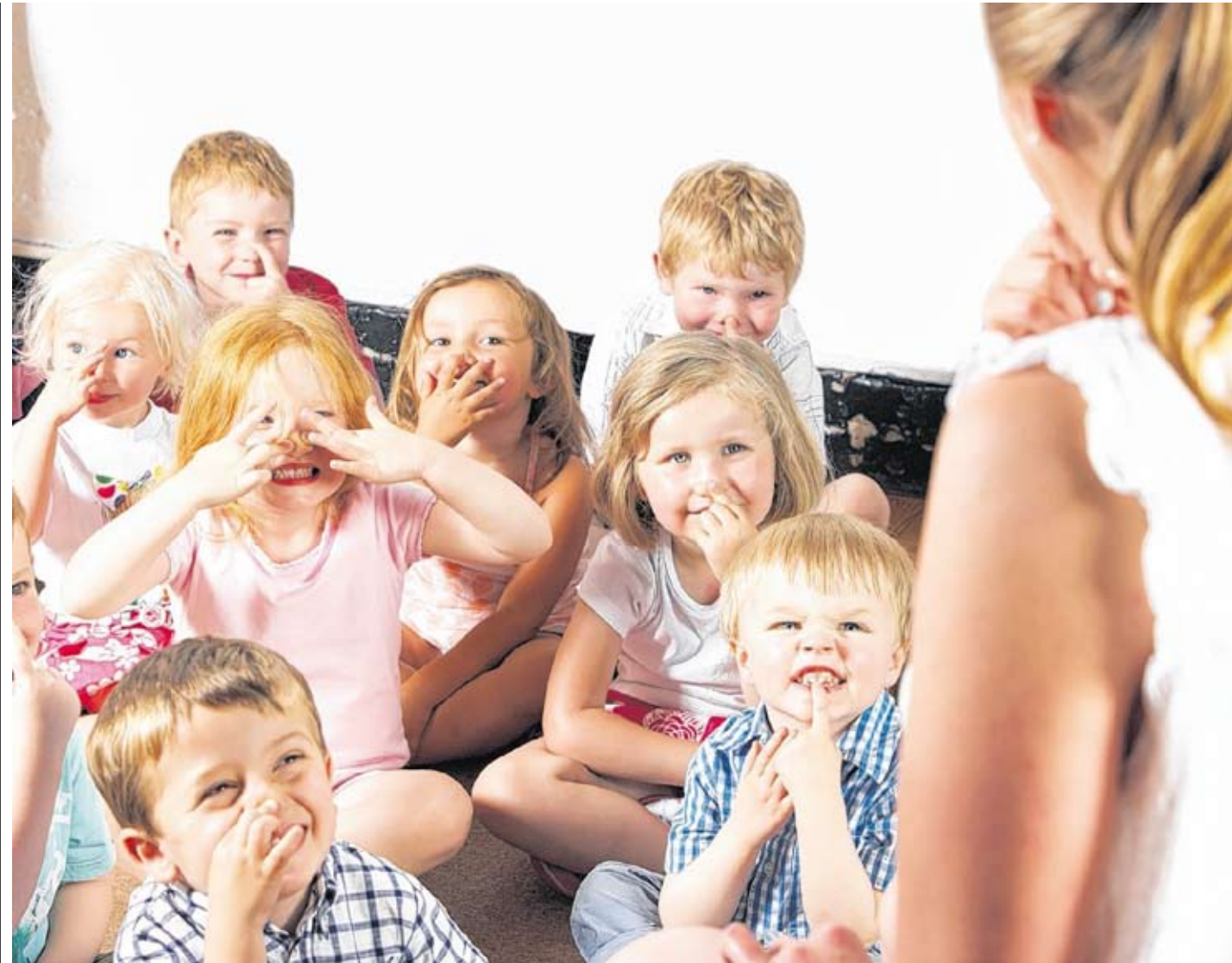
Freude an der Arbeit mit Kindern? – Für angehende Kindergartenpädagoginnen gibt es in Tirol gleich vier berufsbildende Schulen.

waren 18 Monate nach Abschluss in einer weiteren Ausbildung. Nicht ganz so glorreich, aber recht gut, sind die Aussichten mit BMS-Abschluss: Bis zur ersten Erwerbstätigkeit dauerte es im Erhebungszeitraum durchschnittlich 4,1 Monate. Zum Vergleich: Mit Lehre gingen 2,8 und mit AHS-Matura 6,4 Monate bis zum Berufseinstieg. Der Anteil der Personen mit durchgehender Erwerbstätigkeit im zweiten Jahr lag bei 46 Prozent (BHS-Matura: 60 Prozent, Lehre: 50 Prozent, AHS-Matura: 18 Prozent). Die Vorgemerktenquote beim AMS 18 Monate nach dem Abschluss lag bei 11,4 Prozent und war damit gleich hoch wie bei Personen mit Lehrausbildung (11,3 Prozent). Bei BHS-Absolventen waren nach einundzwanzig Jahren 4,9 Prozent vorgemerkt – deutlich weniger als AHS-Maturanten (8,8 Prozent). Das Brutto-Monateinkommen 18 Monate nach dem Schulabschluss lag für BHS-Maturanten bei 1900 Euro – übrigens gleich hoch wie bei Personen mit Lehrausbildung. BMS-Absolventen erzielten 1700 Euro, AHS-Maturanten kamen auf 1500 und Pflichtschulabgänger auf 800 Euro.