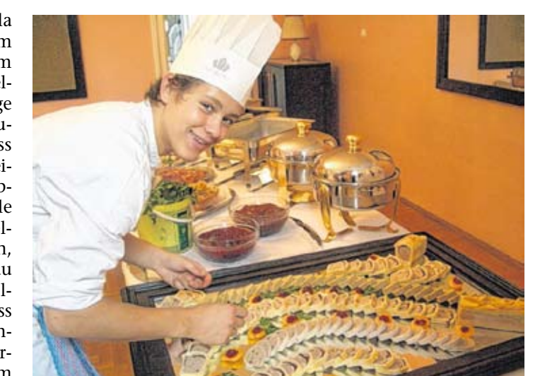
Schüler qualifizieren sich für drei Berufe und die Selbstständigkeit.

Die Tourismusschulen Villa Blanka Innsbruck starten im nächsten Schuljahr mit einem neuen Konzept für die Hotelfachschule: Dieser dreijährige Ausbildungszweig bietet zusätzlich zum Schulabschluss die Anerkennung gleich dreier Lehrberufe: Mit dem Abschluss der Hotelfachschule ist auch die Lehre als Hotel- und Gastgewerbeassistent/in, als Restaurantfachmann/frau und als Koch/Köchin absolviert. Zudem ist im Abschluss die Unternehmerprüfung inkludiert, sodass einem sofortigen Berufseinstieg nichts im Wege steht.