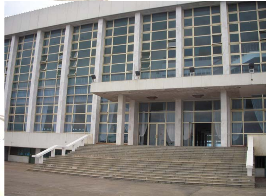
Kongresshaus in Yaoundé, Kamerun