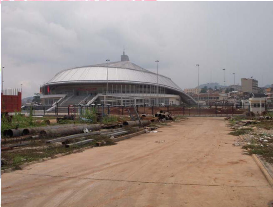
Sporthalle in Yaoundé, Kamerun